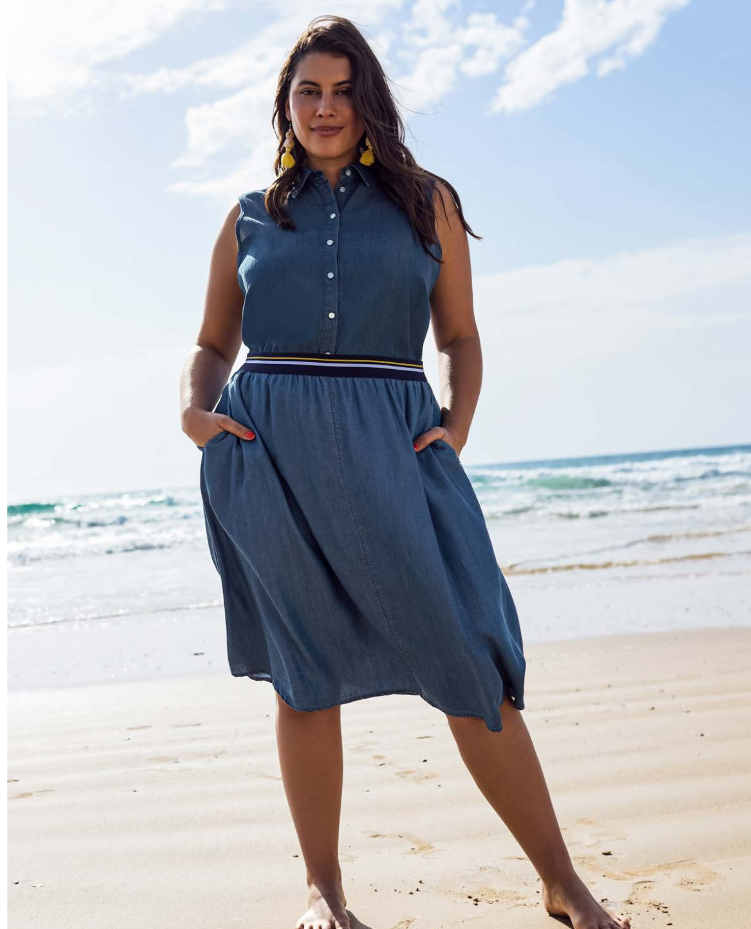
4 Tunika 143911 € 69.99 Ankle Jeans 144188 € 49.99 Bluse 143948 € 39.99 Jeansrock 143950 € 49.99