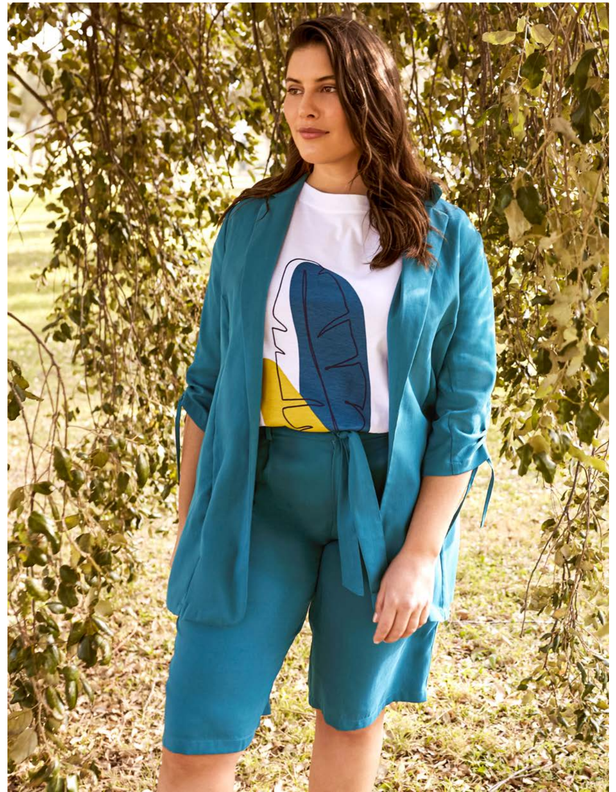
Midikleid 144153 € 69.99 Blazer 144181 € 89.99 T-Shirt 143853 € 19.99 Bermudas 144180 € 59.99