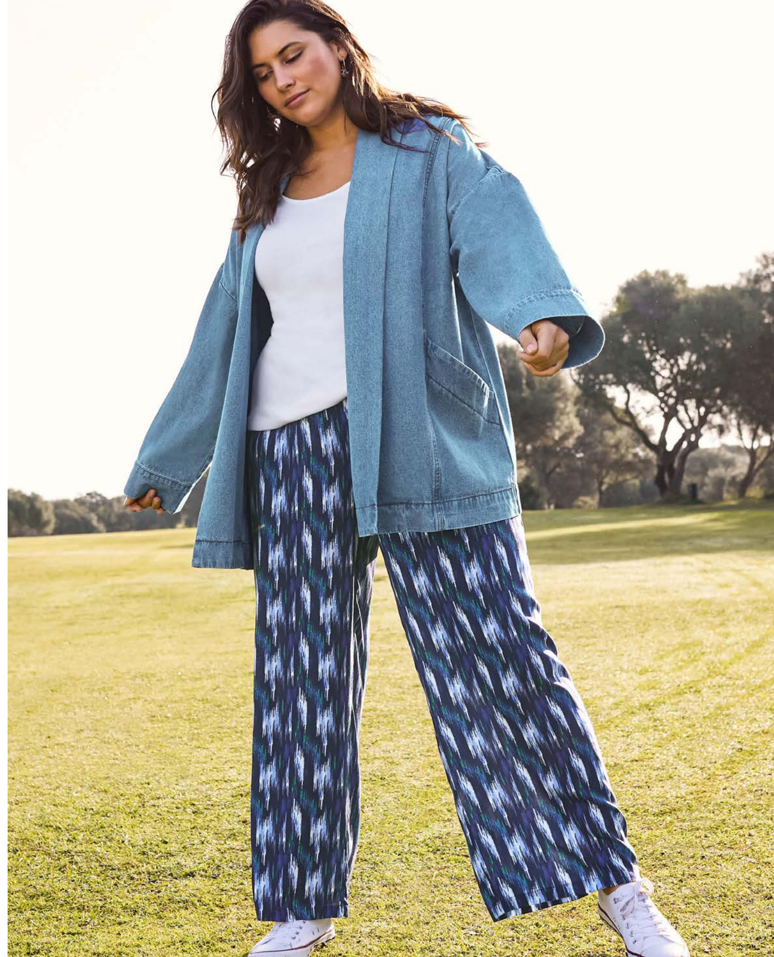
20 Kleid 144115 € 69.99 Blazer 143904 € 69.99 Top 139961 € 9.99 Hose 144041 € 39.99