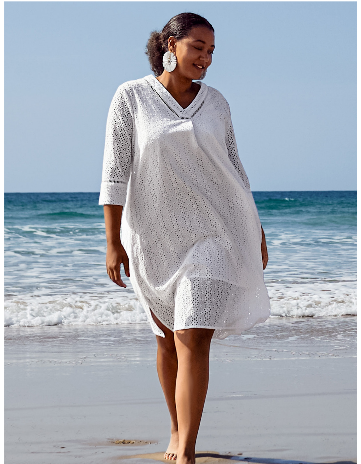
Kleid 143824 € 99.- Midikleid 144218 € 69.99