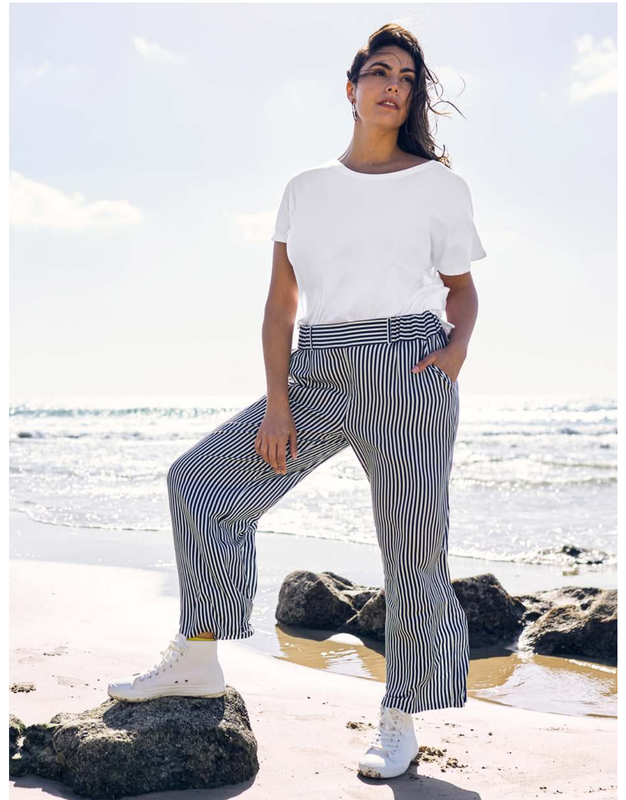
Shirtkleid 143865 € 59.99 T-Shirt 143773 € 34.99 Hose 144044 € 49.99