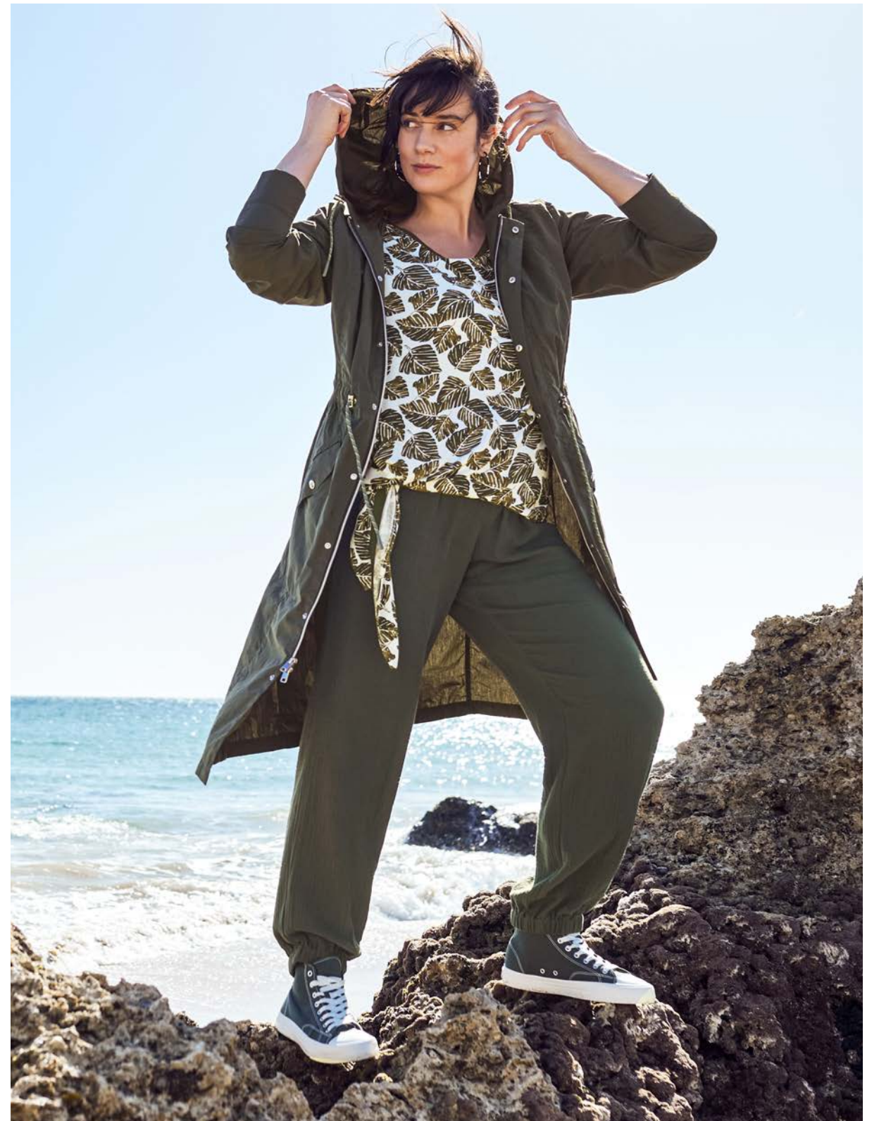
Midikleid 144186 € 79.99 T-Shirt 143748 € 29.99 Mantel 143893 € 89.99 Jogginghose 144183 € 59.99