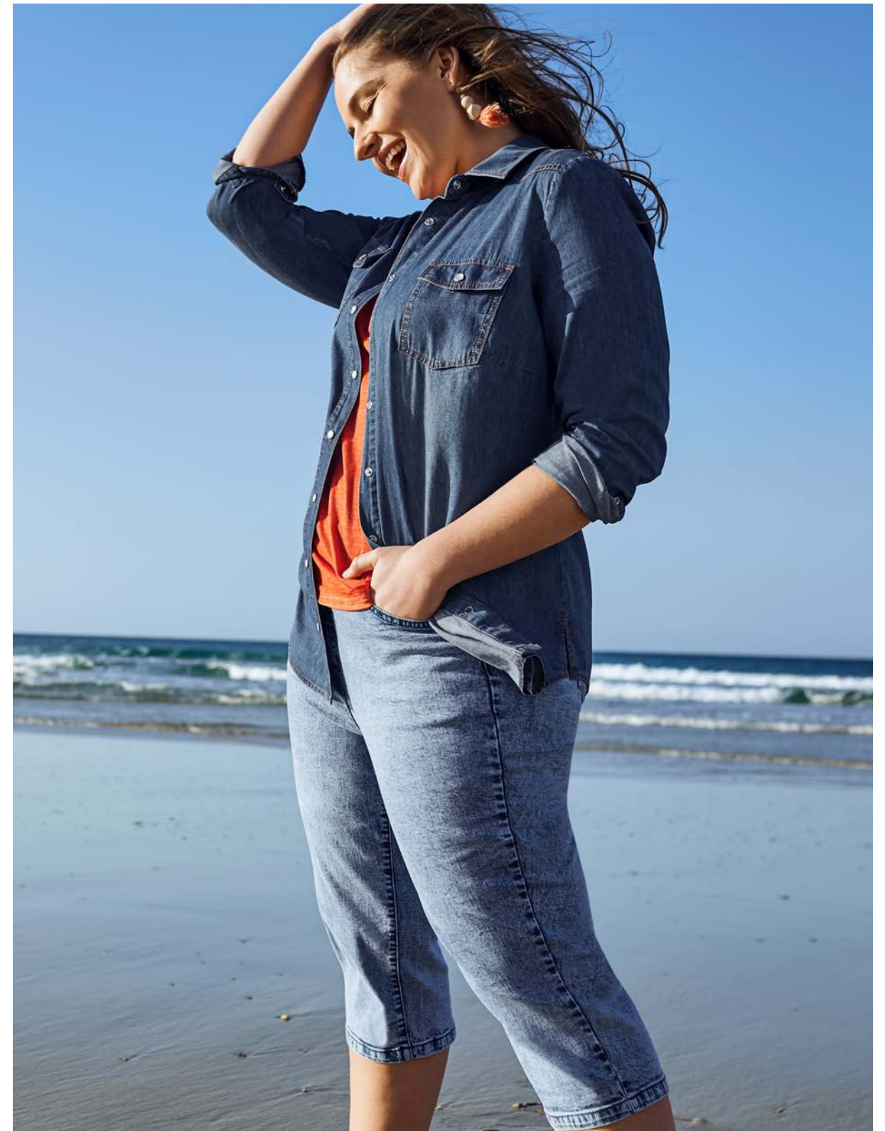
Weste 143951 € 79.99 Top 139961 € 9.99 Jeans 143426 € 69.99 Jeansbluse 140415 € 59.99 Top 144124 € 29.99 Capri-Jeans 144008 € 39.99