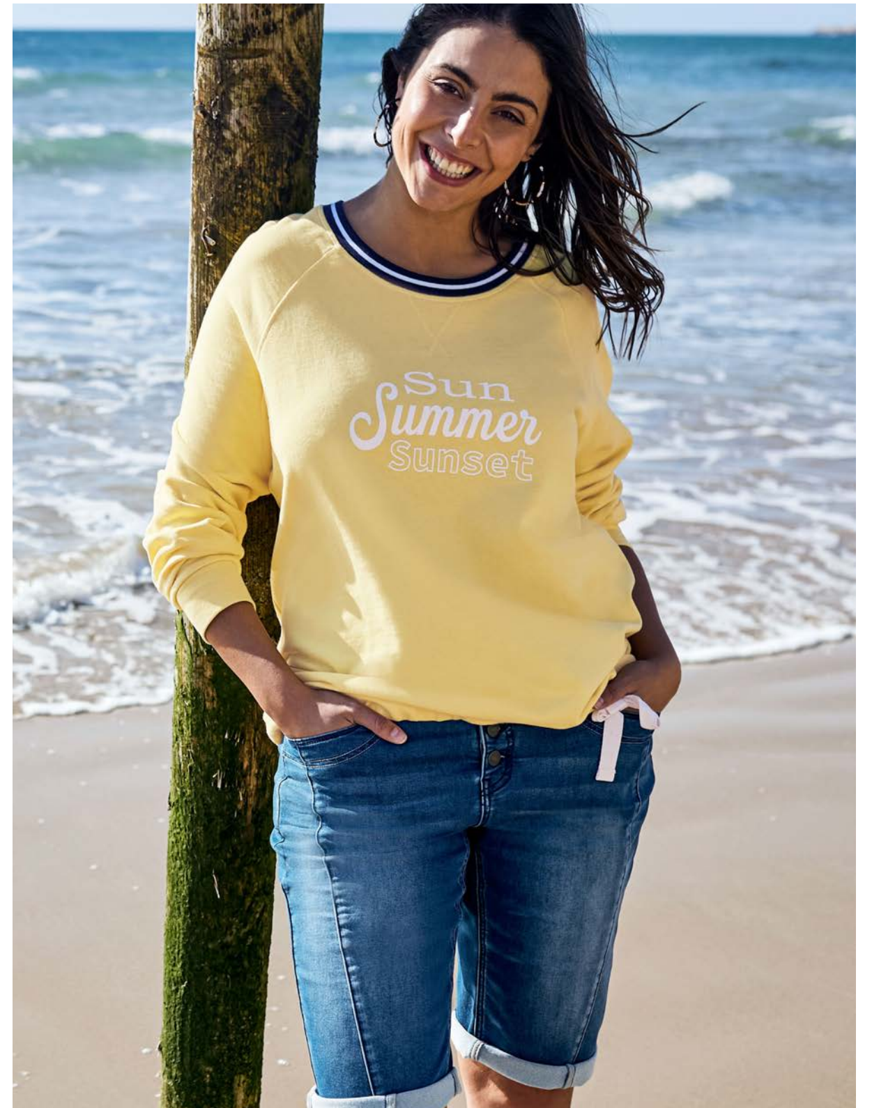
T-Shirt 144006 € 39.99 Jeansrock 143909 € 49.99 Sweatshirt 144128 € 39.99 Bermudas 131393 € 49.99