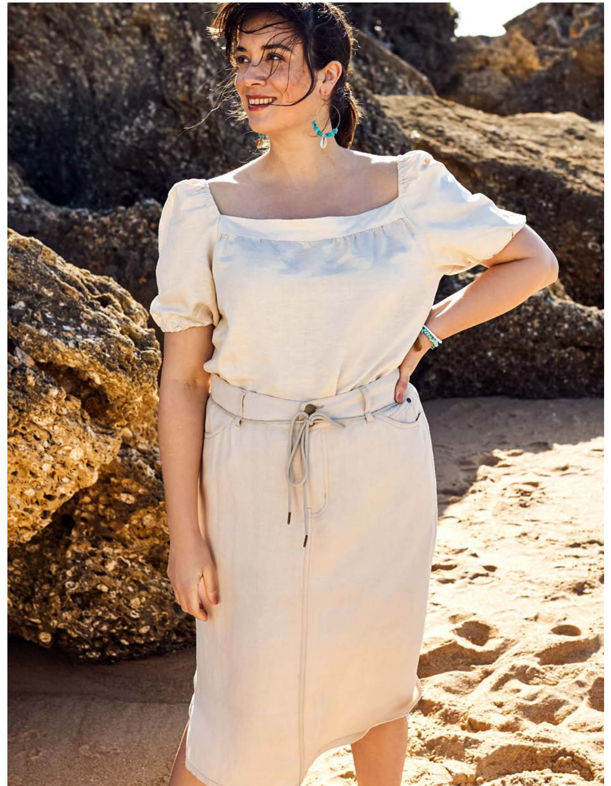
Bluse 143769 € 59.99 Ankle Jeans 144188 € 49.99 Tunika 143959 € 49.99 Rock 143958 € 49.99