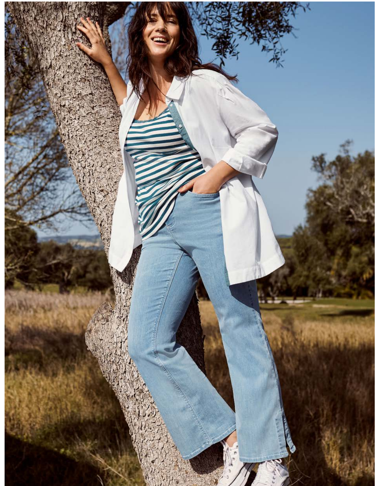
Kleid 143970 € 59.99 Bluse 143968 € 49.99 Top 140477 € 14.99 Bootcut-Jeans 144150 € 59.99